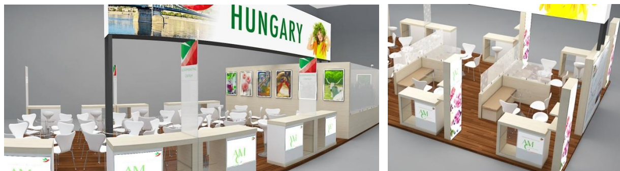
A képek illusztrációk.

Kiállítóink a „Sheikh Saeed” csarnokban található 156 m 2 -es, központi elhelyezkedésű nemzeti standon közösségi vagy egyéni standrészt igényelhetnek. A megújult arculati elemekkel felépített standon résztvevő kb. 15 kiállítóinak árubemutatói és információs lehetőséget, közös tárgyalási felületet, míg kb. 5 egyéni kiállító számára szintén arculatos építésű, egyenként 9 m 2 -es, átlátszó paravánokkal elhatárolt – saját grafikával és tárgyalófelülettel ellátott – területet (bokszt) biztosítunk ugyanezen célokból.