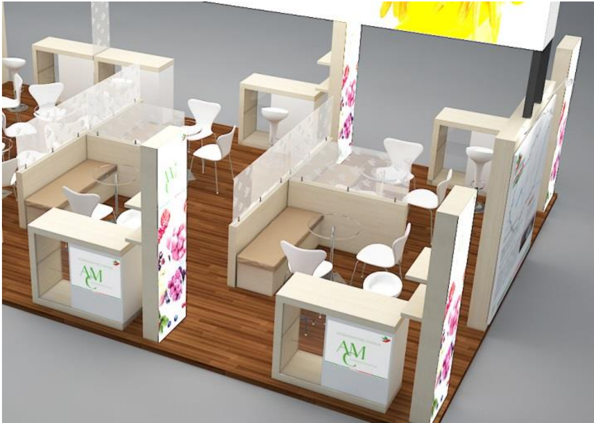
A képek illusztrációk.

Egyéni kiállítóink saját grafikával és tárgyalófelülettel ellátott, elkülönített standrészt (boxot) igényelhetnek: