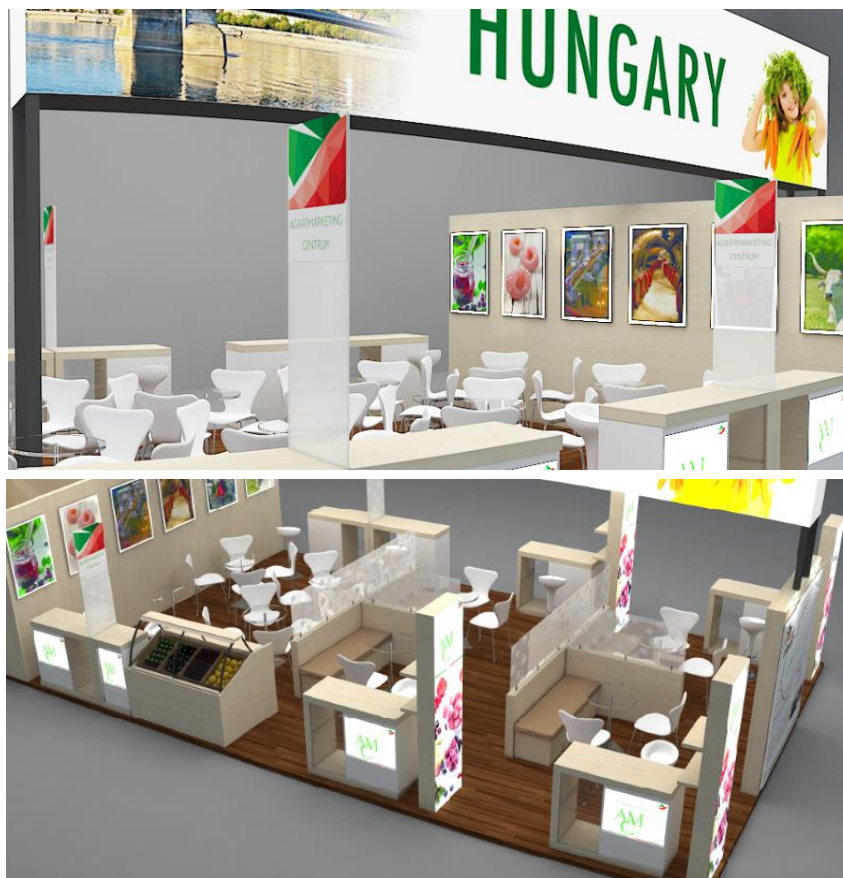
A képek illusztrációk.

Először 2016-ban szerveztünk nemzeti megjelenést az FHA kiállításon, egy 42 m 2 -es standon 7 kiállító részvételével. 2018-ban a 9-es pavilonban 66 m 2 -en jelentünk meg 5 kiállítóval és egy nagy sikerű látványkonyhával. 2020-ban 54 négyzetméteres standunk a 8-as pavilonban kap helyet, melyen a kiállítói megjelenéseken túl szintén látványkonyhát tervezünk.