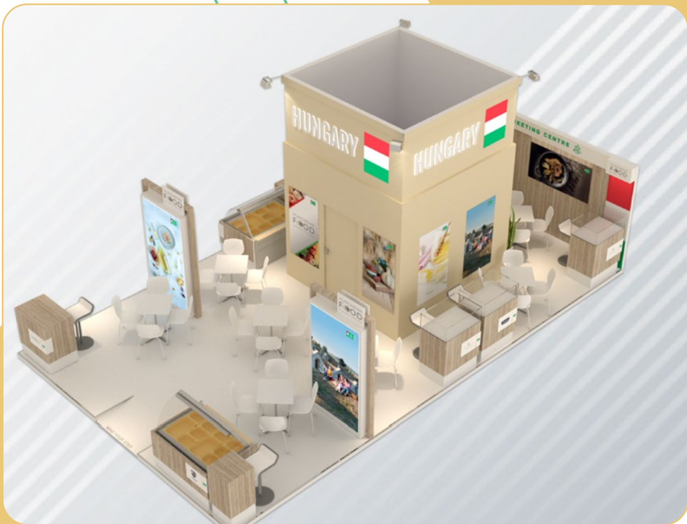
A kép illusztráció.