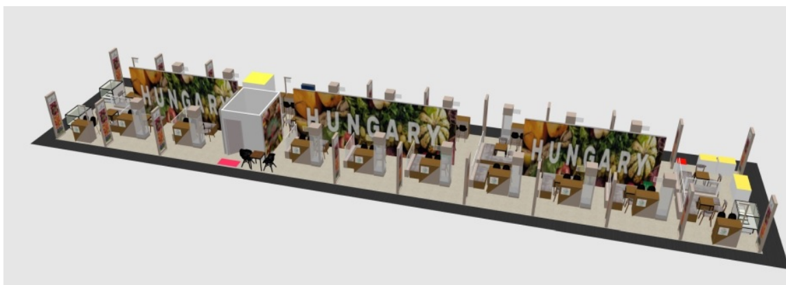
A kép illusztráció.