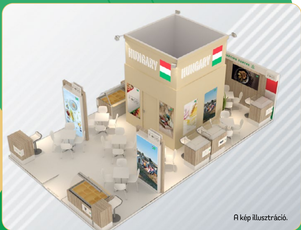
A kép illusztráció.